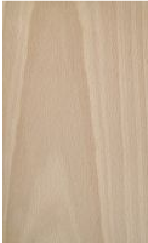
„Holzbild“ Buche; Quelle: Florian Riefling, HWK Dresden